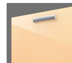
ショートハンドル取手