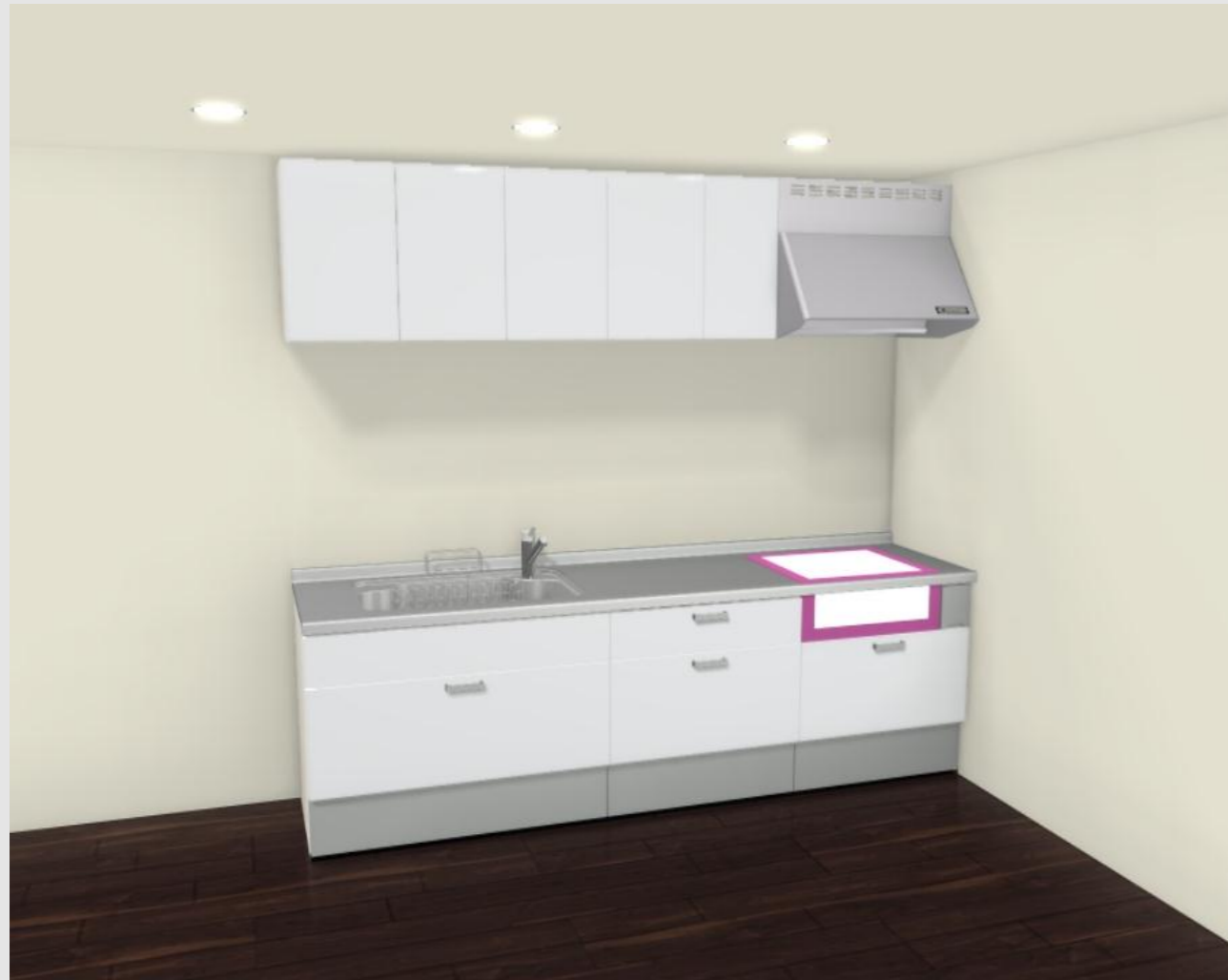
CG合成によるイメージ画像です。 現場調達品、シリーズ外選定品に関しては表現しておりません。