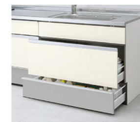
スライドストッカー(ポケットなし)