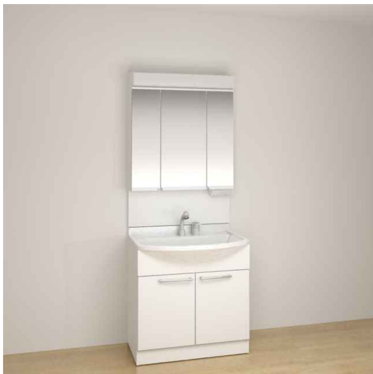
※画像はイメージです。組合せなどはお見積書をご確認ください。